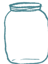
duży słoik z zakrętką