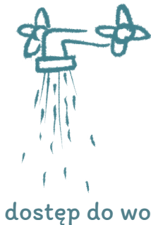
dostęp do wody