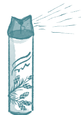
odświeżacz powietrza lub dezodorant

pomoc kogoś dorosłego lub starszego rodzeństwa (rodzeństwo jest wystarczająco „starsze”, gdy zgadza się pomóc w zamian za danie mu spokoju przez resztę dnia)