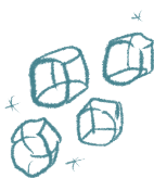
4 kostki lodu

pomoc kogoś dorosłego lub starszego rodzeństwa (rodzeństwo jest wystarczająco „starsze”, gdy zgadza się pomóc w zamian za danie mu spokoju przez resztę dnia)