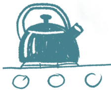
czajnik zwykły lub elektryczny