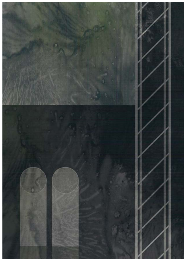
Katarzyna Błachowska / PLSP w Supraślu

te poletko należy do mnie, lewy styk zostawię.