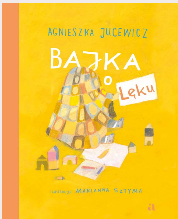
Agnieszka Jucewicz, Bajka o Lęku , Agora dla dzieci, 2022