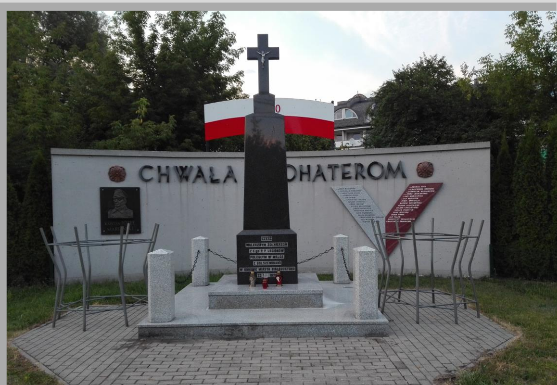
Pomnik Żołnierzy 1. Pułku Piechoty Legionów.