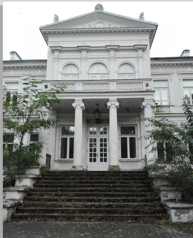
Pałac Lubomirskich w Dojlidach. Fot. Izabela Szymańska, 2020 r.