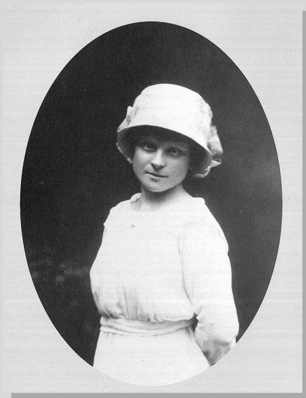
Maria Dąbrowska ok. 1914 r.

W 1924 r. Maria Dąbrowska tak oto opisała białostocki dworzec: (...) cieszymy się, że dworzec wewnątrz tak pięknie odnowiono. Warszawa przecież nie ma takiej sali bufetowej. Wysoka, śmigająca białymi ścianami ku sufitowi, pod którym płoną jaśniejące misy lamp. Na tle olbrzymich okien, szafirowych od zmierzchu, piętrzą się na bufecie stogi ognistych pomarańczy (...).