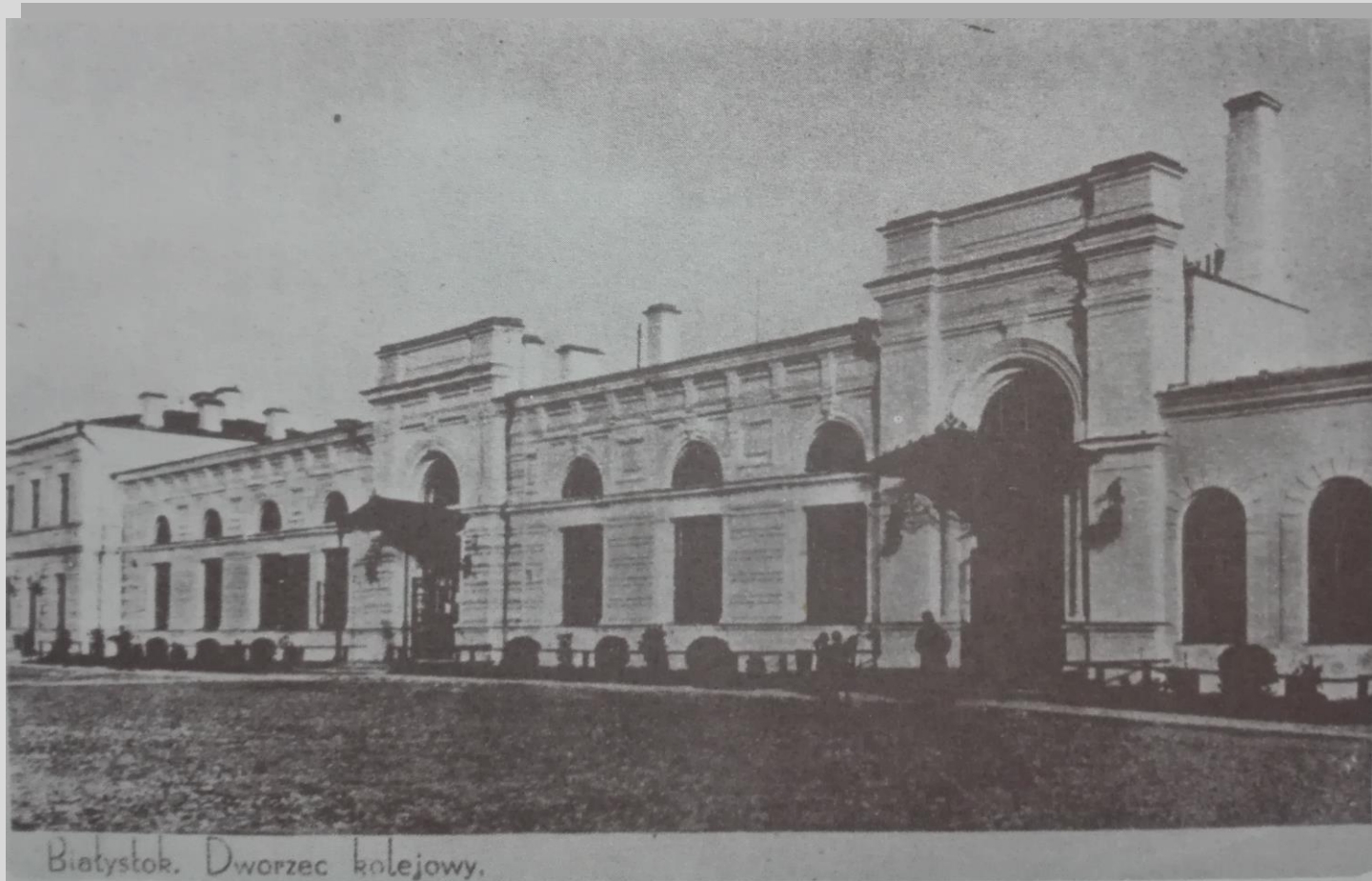
Dworzec kolejowy w Białymstoku w 1935 r.

i sufitów, żeliwne słupy oraz ozdobne posadzki. Wnętrze obiektu nawiązuje swoim wyglądem do tego z około 1910 r.