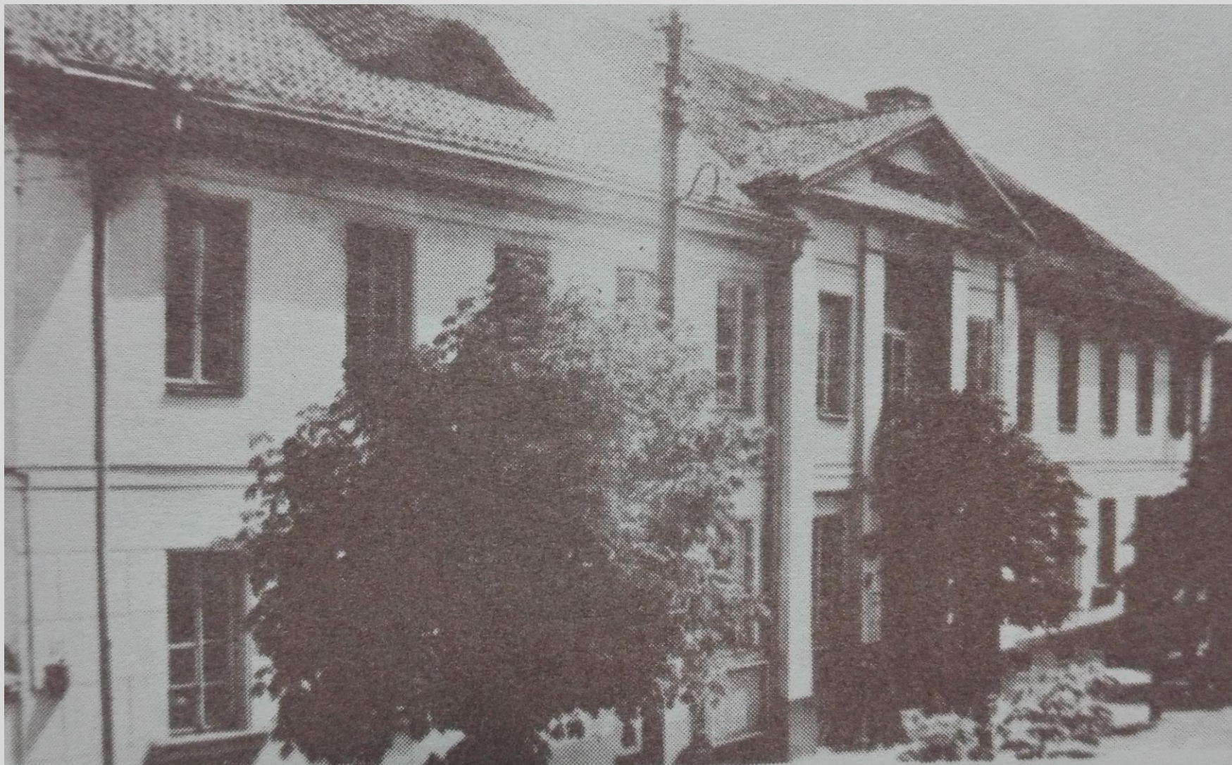
Ulica Warszawska ok 1938 r. Budynek Magistratu.