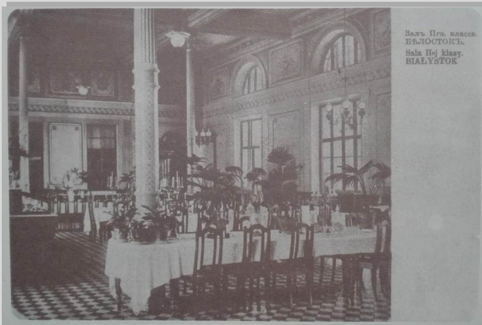
Залъ Прѣ. класса. БѢЛОСТОКЪ. Sala IIej klasy. BIAŁYSTOK

Dworzec kolejowy w Białymstoku ok 1910 r. Restauracja.