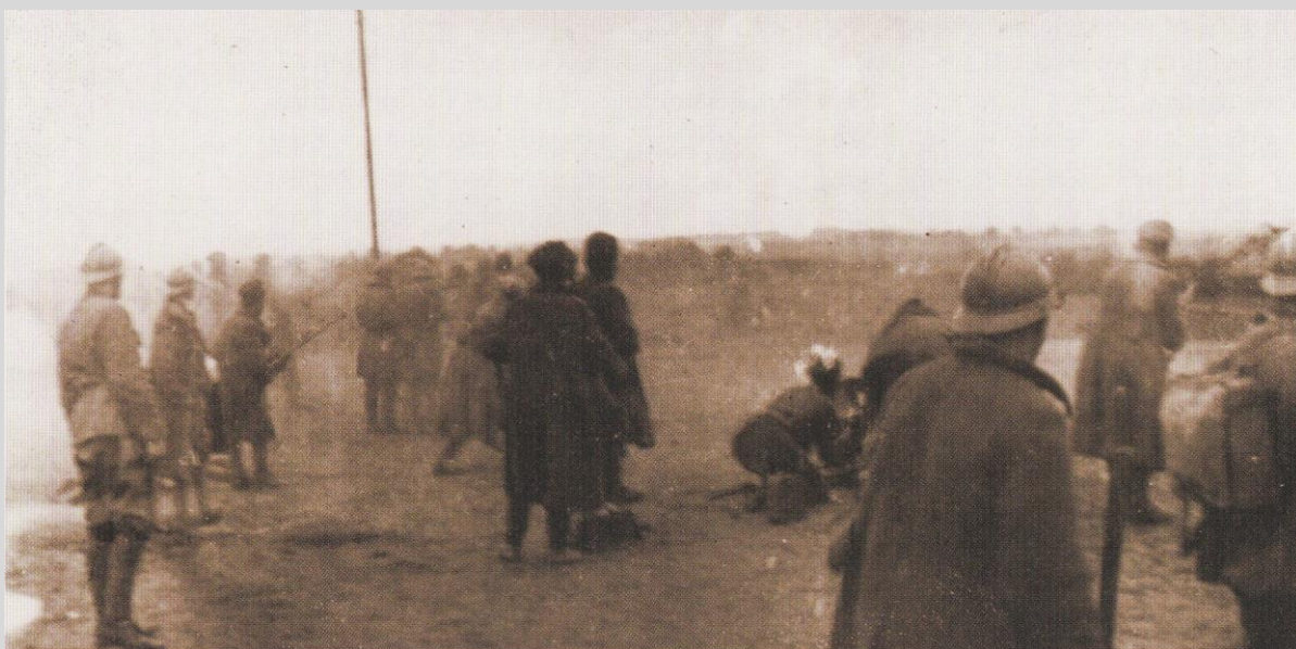
Legioniści I batalionu w trakcie porannego natarcia na Białystok