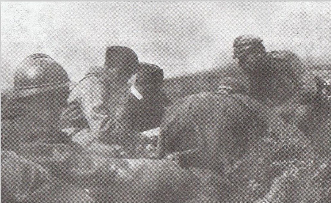
Przed natarciem, sierpień 1920.

Bitwa ta stała się jednym ze znaczących polskich zwycięstw w wojnie polsko-bolszewickiej, a w dziejach Białegostoku jedną z największych bitew.