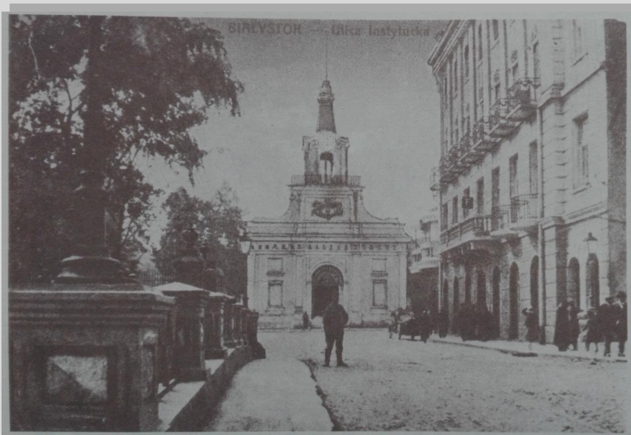
Ulica Instytucka ok. 1910. Widoczna brama pałacowa i Hotel Ritz (po prawej).

przedwojenną. Dawna ulica biegnąca do samej bramy pałacowej została mocno przebudowana. Zniknęły kamieniczki, nie ma już Hotelu Ritz, a ulicę rozdzieliło rondo.