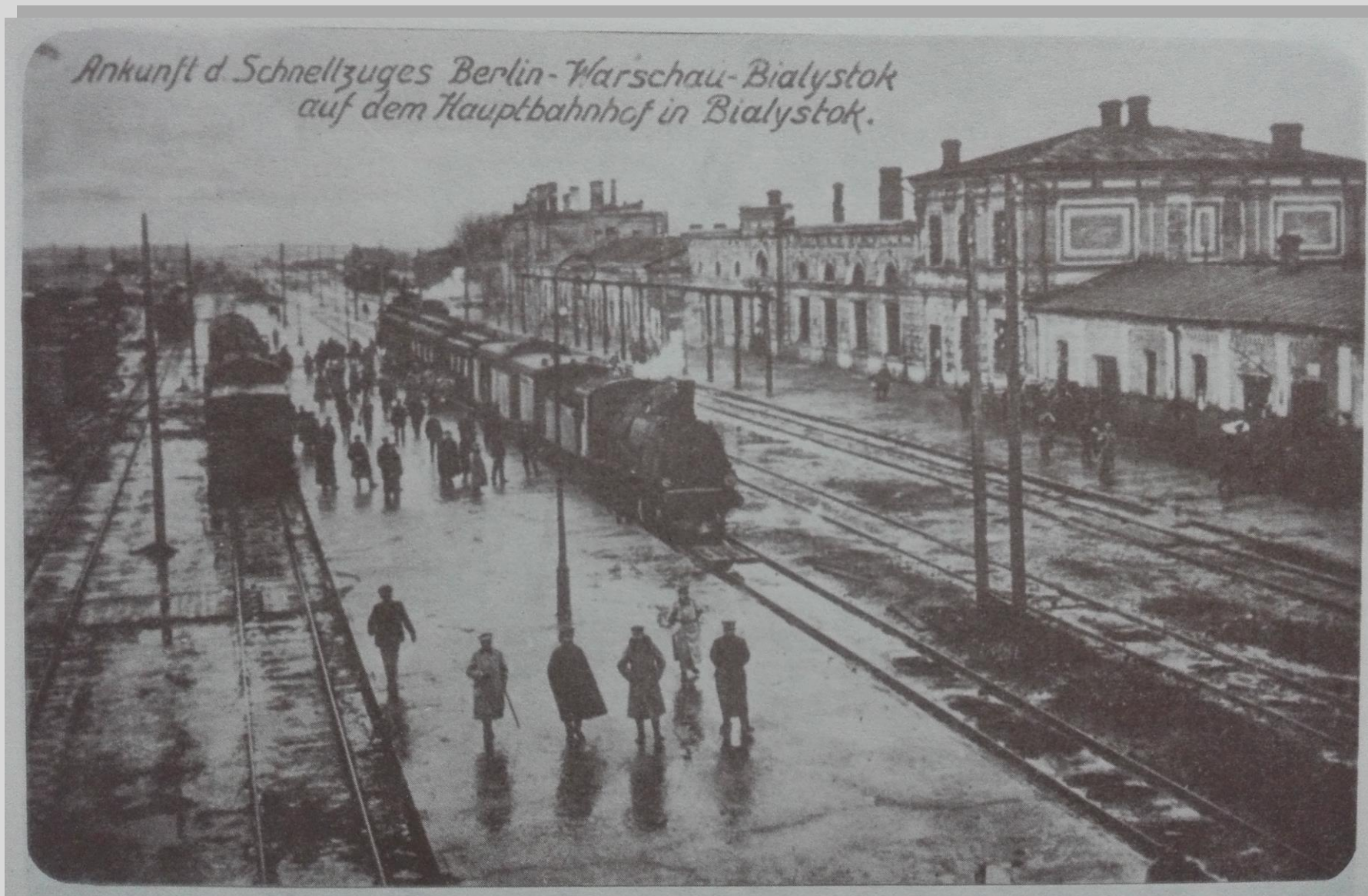
Dworzec kolejowy w Białymstoku ok 1916 r. Perony dworcowe.