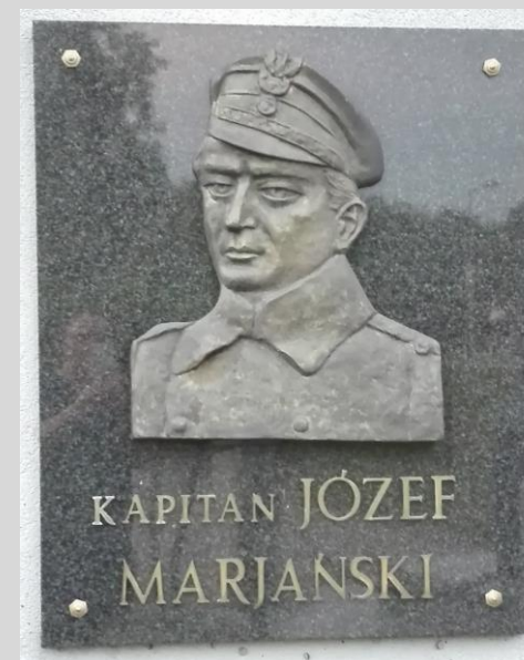
Tablica kpt. Józefa Marjańskiego na Pomniku Żołnierzy 1. Pułku Piechoty Legionów. Fot. Izabela Szymańska, 2020 r.

źródło: M. Gajewski, Najdzielniejszy z dzielnych , Białystok 2016, s. 11.