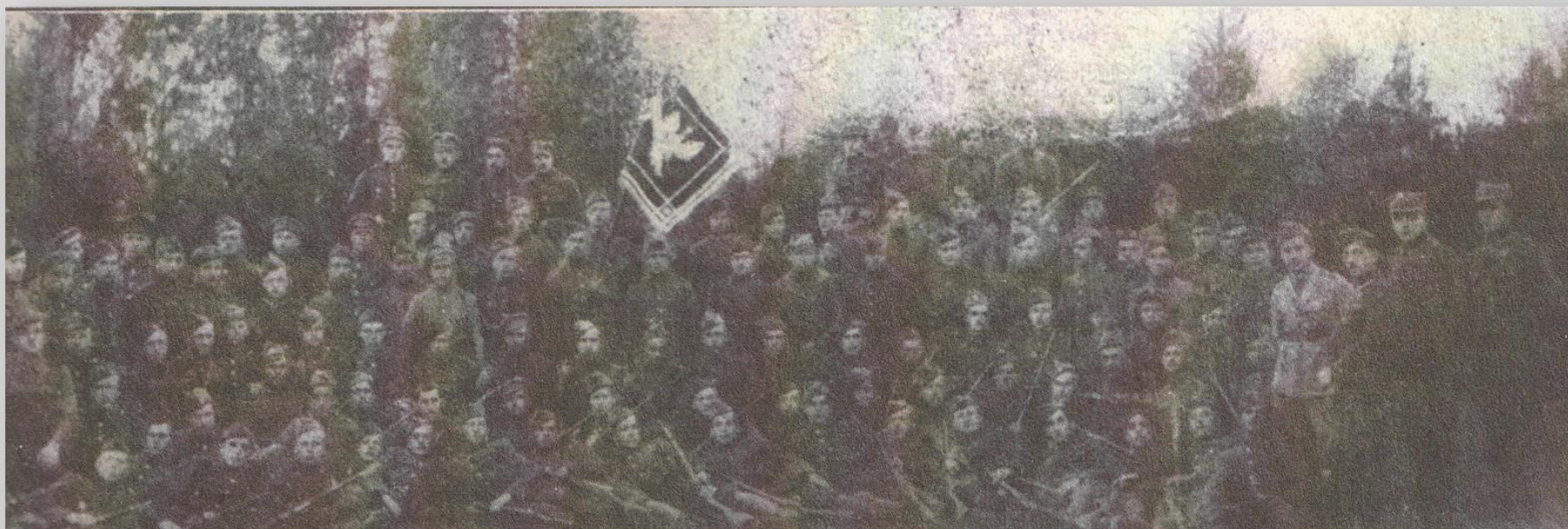
I baon 1. Pułku Piechoty Legionów, który brał udział w walkach o Białystok w sierpniu 1920 r.

Kilkunastogodzinne zmagania o Białystok z 22 sierpnia 1920 r. odznaczyły się ogromną determinacją uczestników walk. Sytuacja na polu walki była zmienna, ale żołnierze polscy z zaciętością walczyli o każdą ulicę, zaułek i dom. Najczęściej, o wyniku potyczek oddziałów polskich i rosyjskich, decydowała odważna walka wręcz z użyciem granatów, kolb i bagnetów oraz element zaskoczenia.