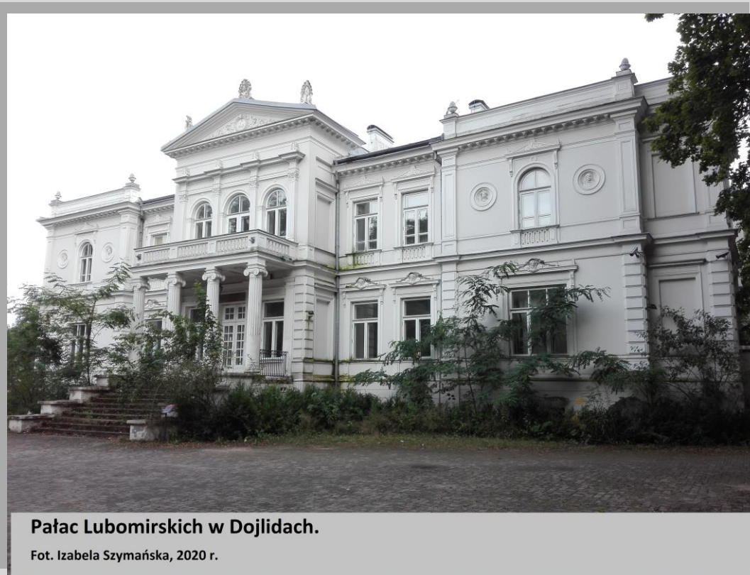
Pałac Lubomirskich w Dojlidach.

W 1954 r. Dojlidy zostały przyłączone do miasta Białegostoku.