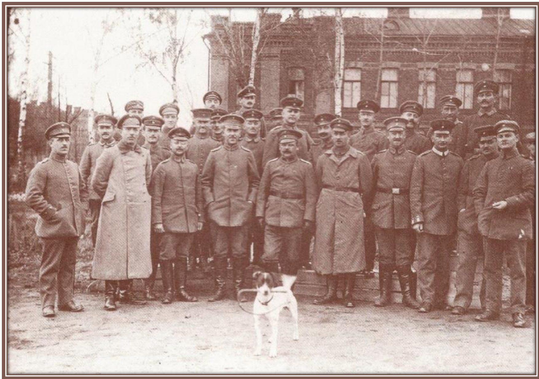
Żołnierze niemieckiego garnizonu w Białymstoku – 1918 r.