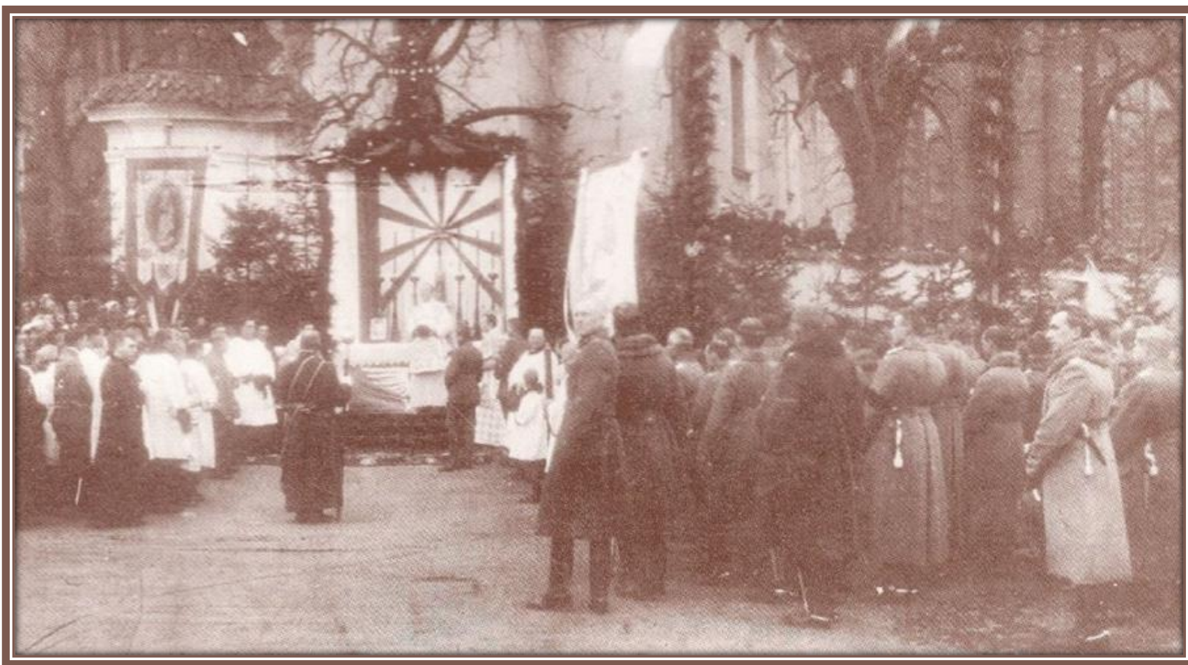
Msza polowa – 22 listopada 1919 r.