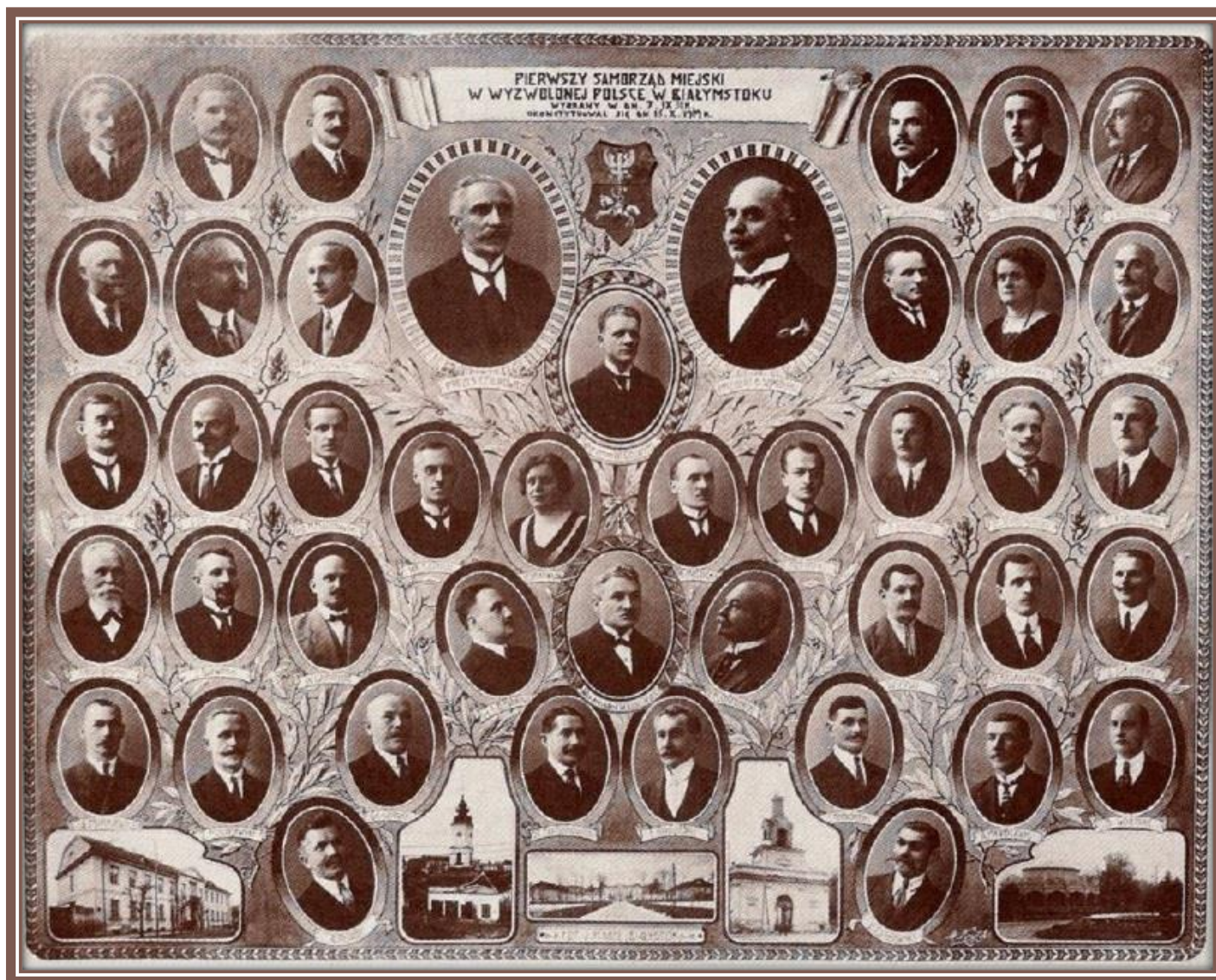
Pierwsza Rada Miejska Białegostoku. W jej skład wchodziły 42 osoby. Wśród nich znaleźli się m.in.: nauczyciele, aptekarze, księgowi, rolnicy, kupcy, lekarze, włókniarze, adwokat, właściciel księgarni i ksiądz.