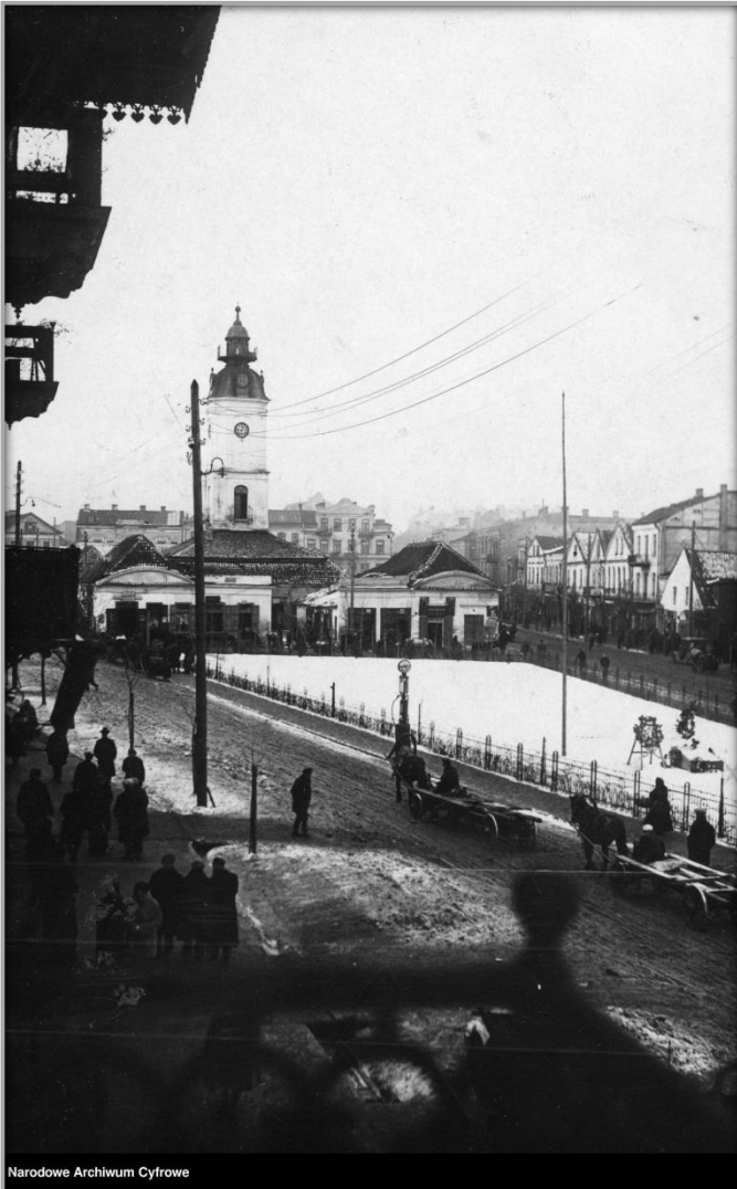
Rynek Kościuszki, w głębi widoczny ratusz ~ 1918 r.

Białystok na wyzwolenie musiał czekać nieco dłużej niż reszta kraju, choć już w listopadzie 1918 roku utworzono tu komitet obywatelski, jako namiastkę polskiego samorządu. Uformowano także ochotniczą Samoobronę, dbającą o bezpieczeństwo w mieście. Jednocześnie niecierpliwie oczekiwano na wkroczenie wojsk polskich.