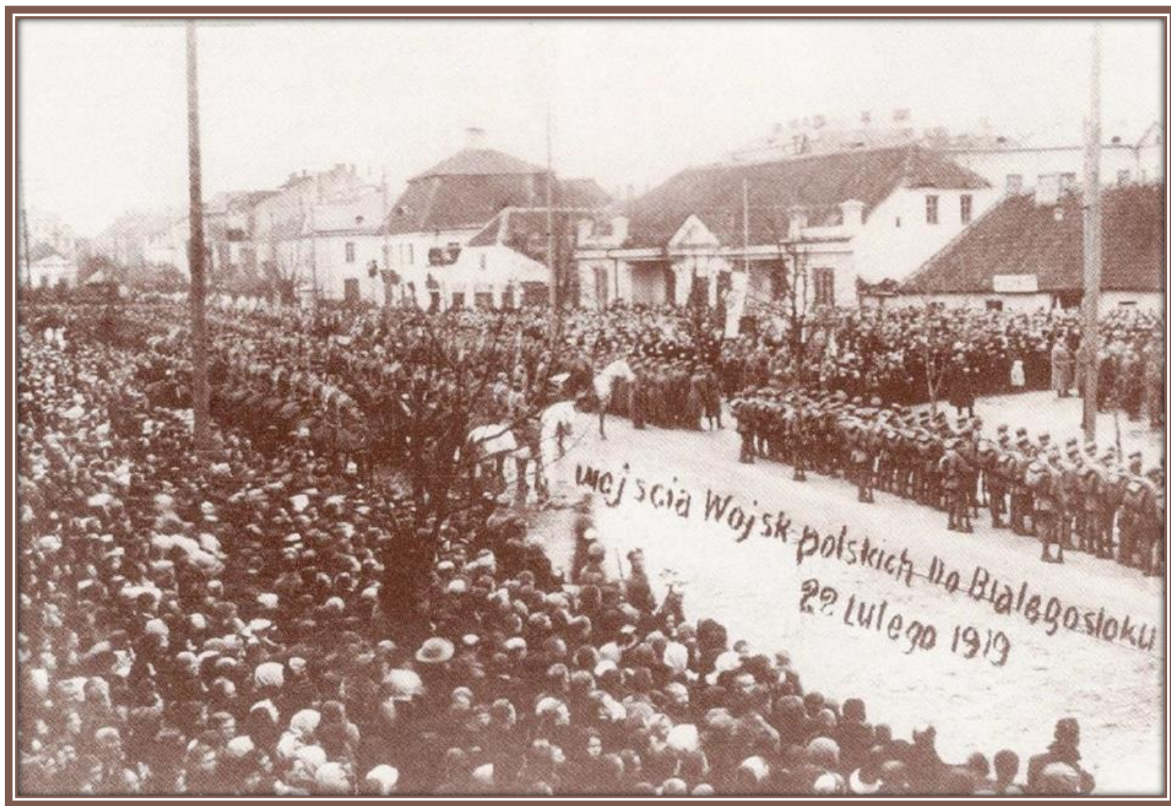
Mieszkańcy Białegostoku tłumnie powitali polskich żołnierzy – 1919 r.