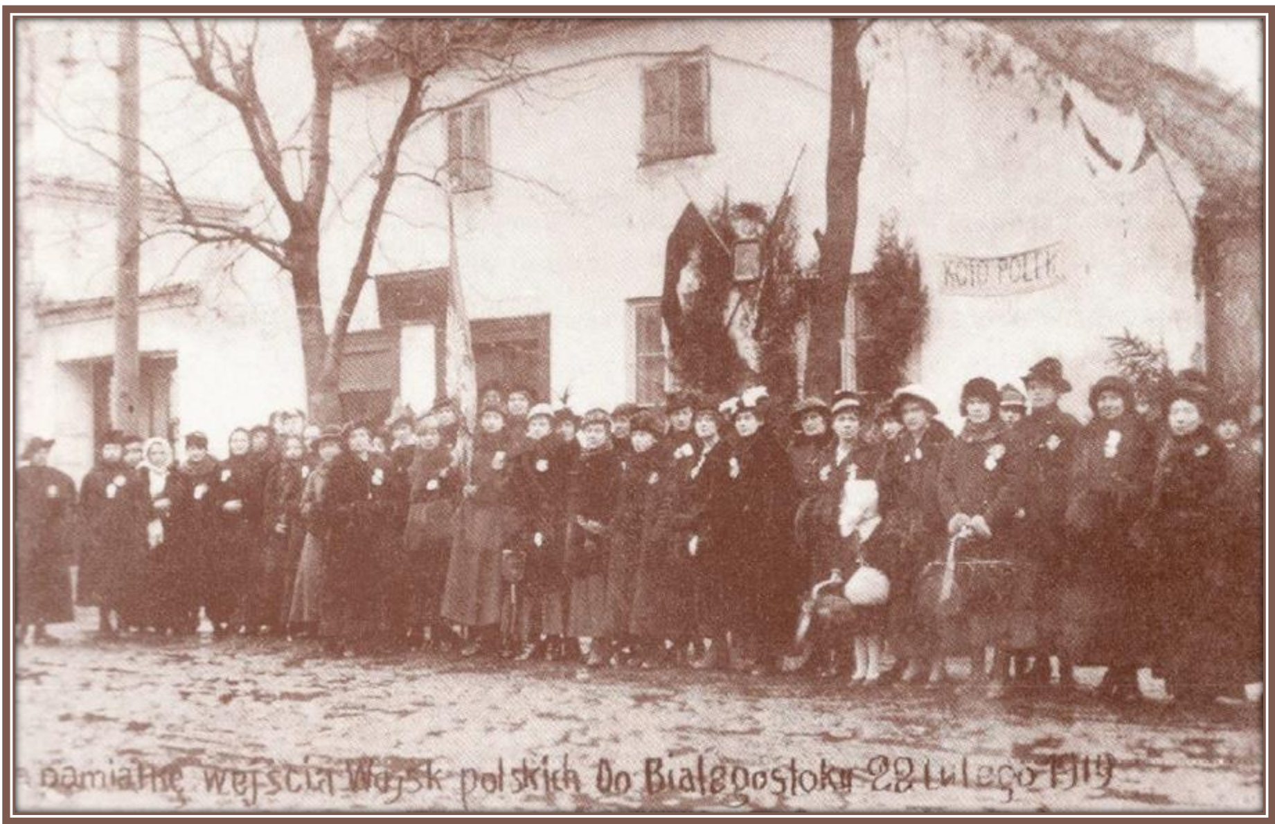
Przedstawicielki Koła Polek w oczekiwaniu na wojsko polskie – 1919 r.