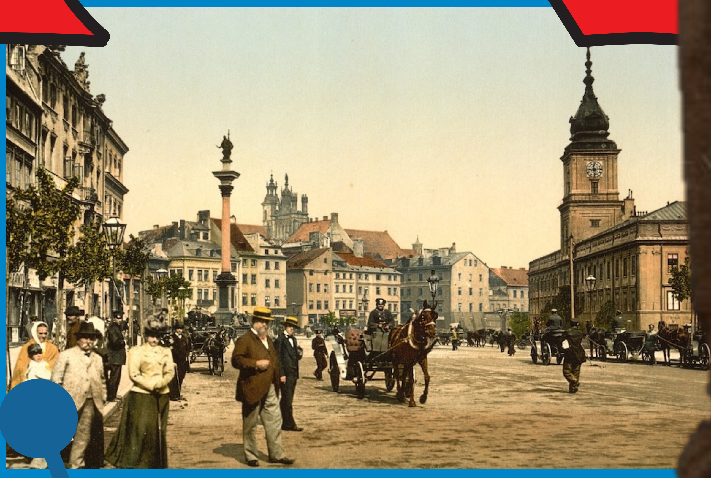
Warszawa czasów młodości Cypriana Kamila Norwida

Jego biografii towarzyszy smutek: sieroctwo, brak pieniędzy i tęsknota za Ojczyzną. Był niesłusznie więziony, zapadł na głuchotę, a w dodatku odszedł w zapomnienie.