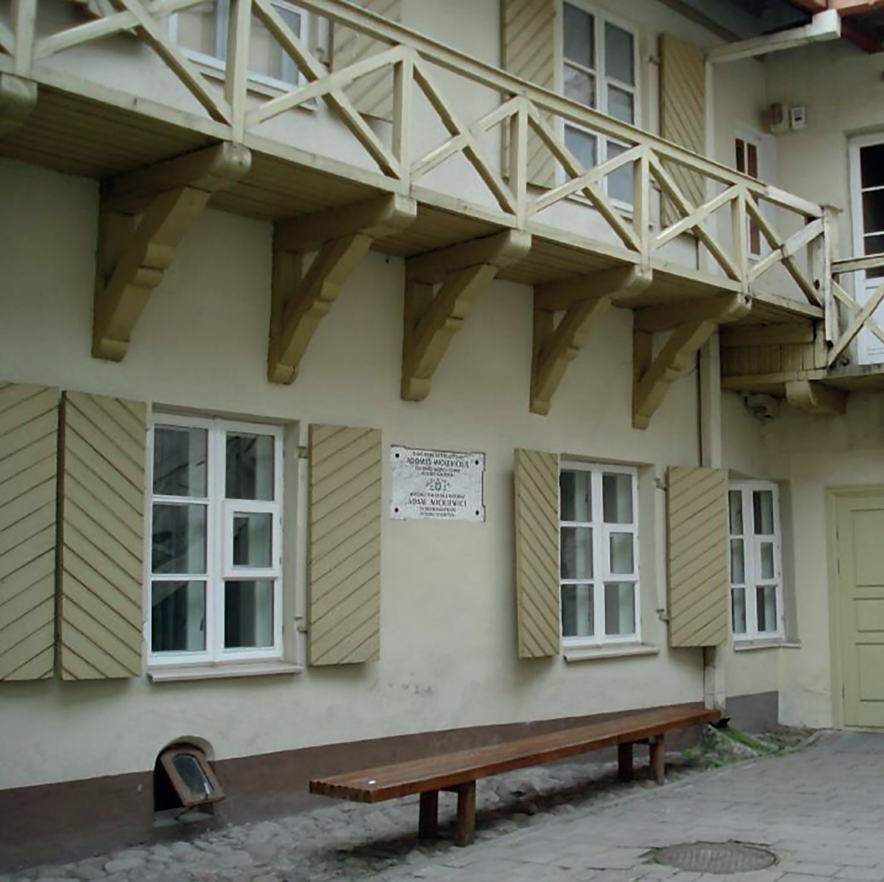
Muzeum Adama Mickiewicza w Wilnie