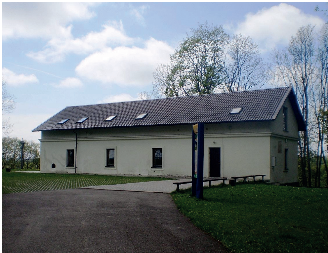
Szetynie, Centrum Kultury im. Czesława Miłosza